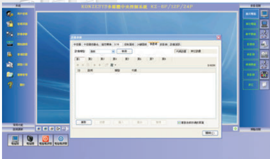
MCCS™ 按鍵面板編輯畫面

KP-9 為投影機、投影幕的最佳控制伴侶，也可以靈活控制第三方設備，嵌牆式安裝，當投影機遙控遺失也能正常控制；一體化合金材質的控制面板及帶LED背光顯示按鍵，外形更美觀大方，具有RS-232/485控制介面；並具有兩組繼電器乾接點端子，具連動管理功能及可擴充模組設計。